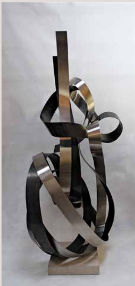
LAOCOONT 2014, ferro, acer inoxidable i pedra d'Uldecona, 172x74x72