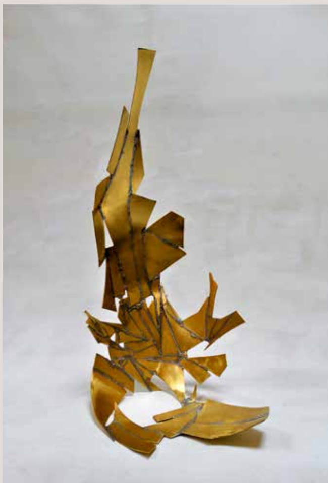
UNIT 2019, llautó i estany, 65x30x35