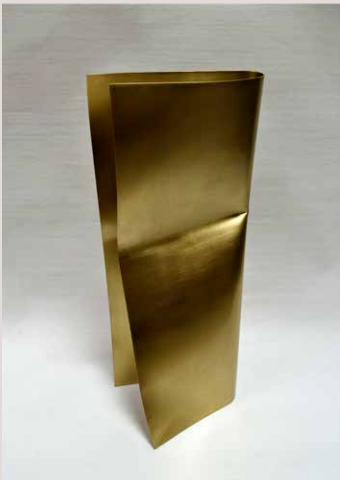
PLEC 2018, llautó, 48x20x15