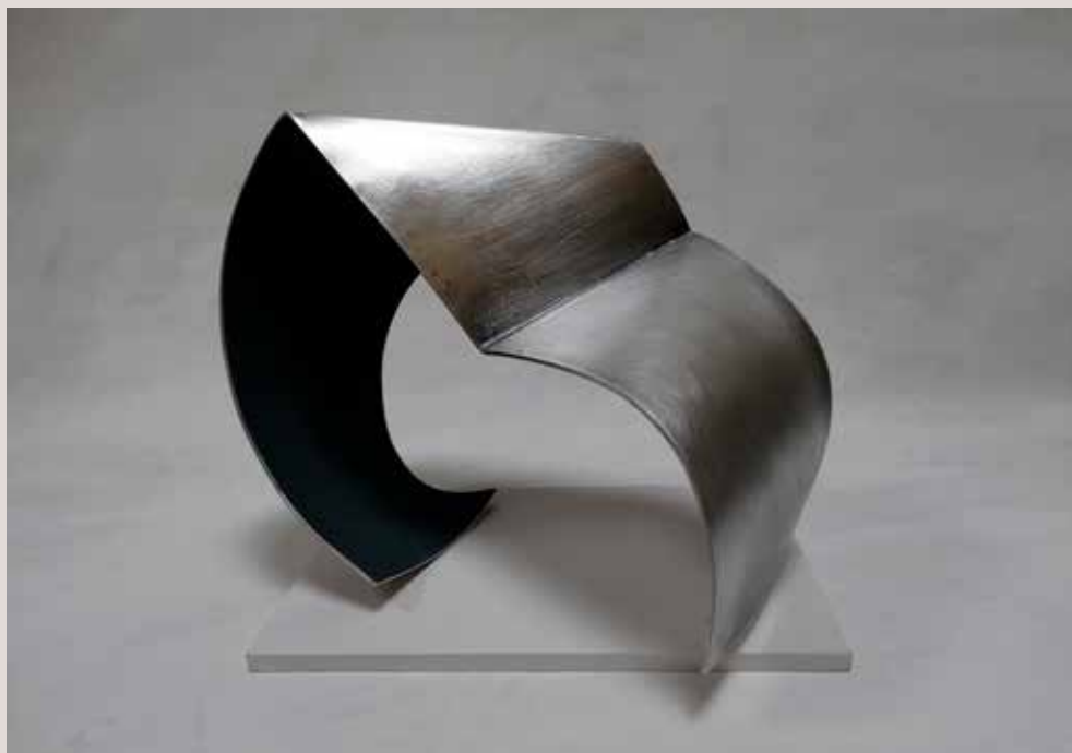
ROMP 2019, alumini, pigments i pedra silestone blanc, 25x34x29