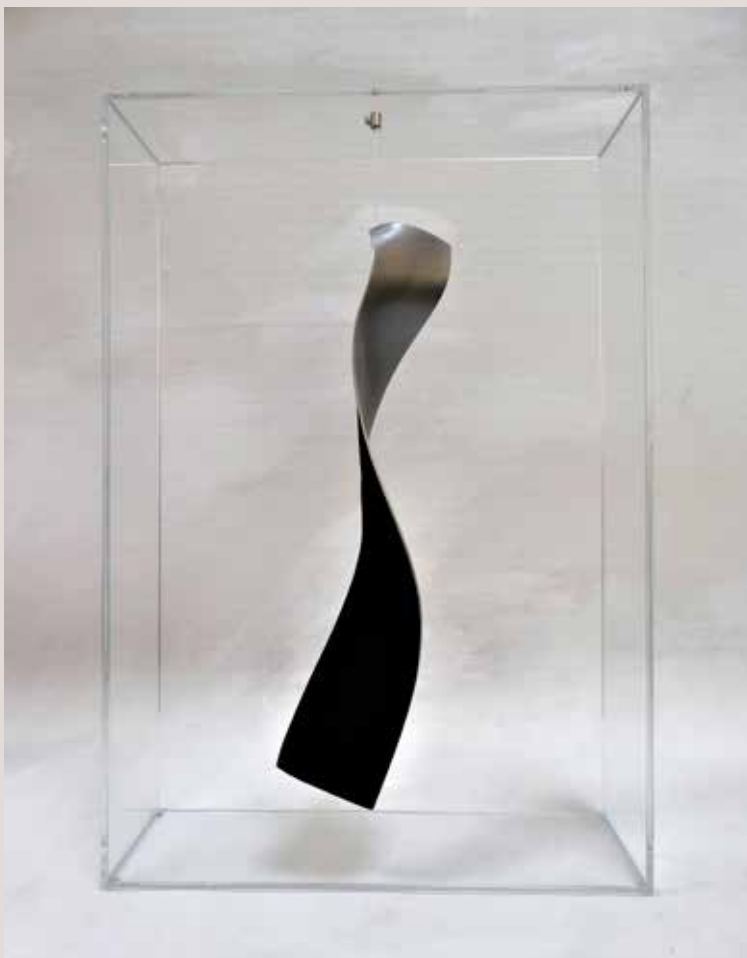
BI MÒBIL I 2017, alumini, pigments i vidre, 51,5x35x10