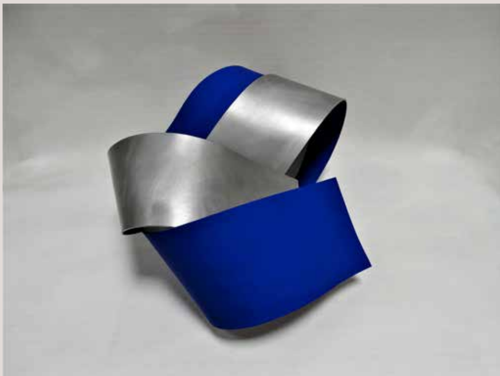
ACULL 2018, alumini i pigments, 25x48x43