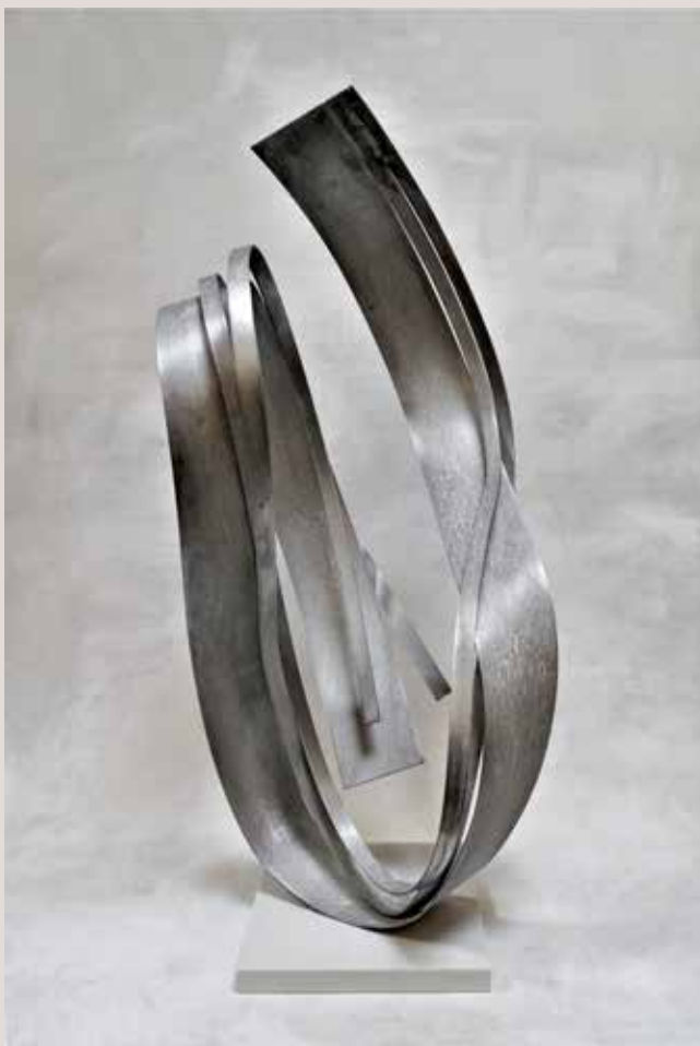
FILLOL 2019, alumini i pedra silestone blanc, 102x45x49