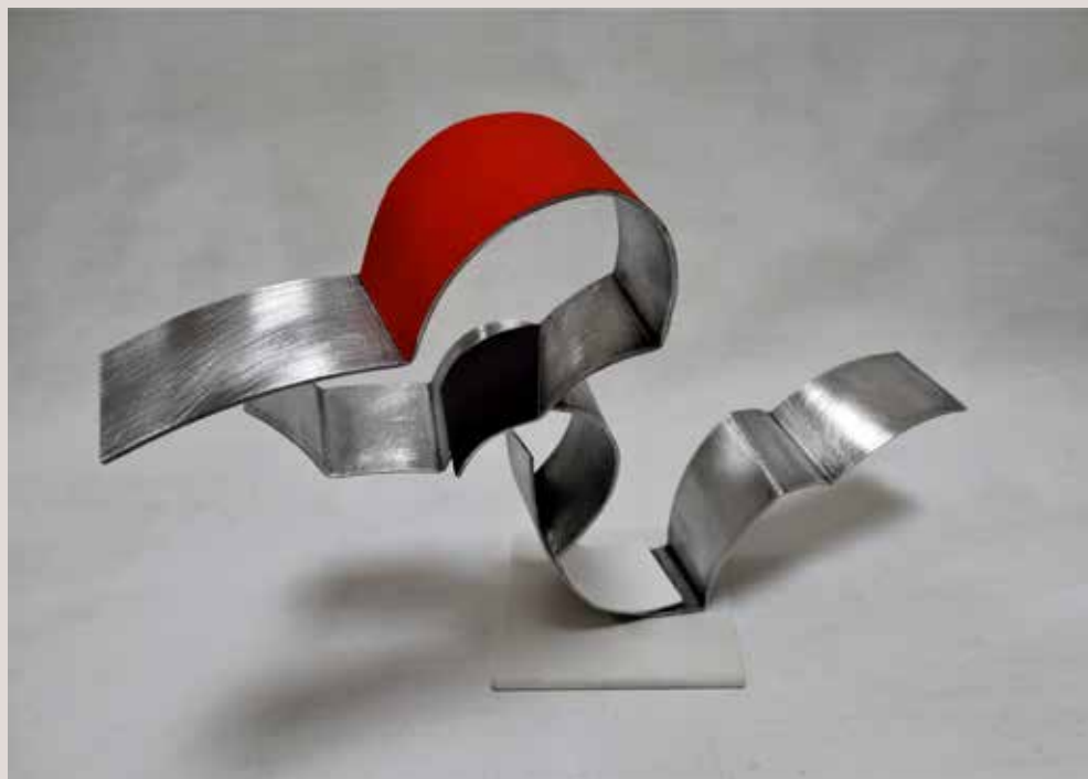
ROMP 2019, alumini, pigments i pedra silestone blanc, 24x35x22