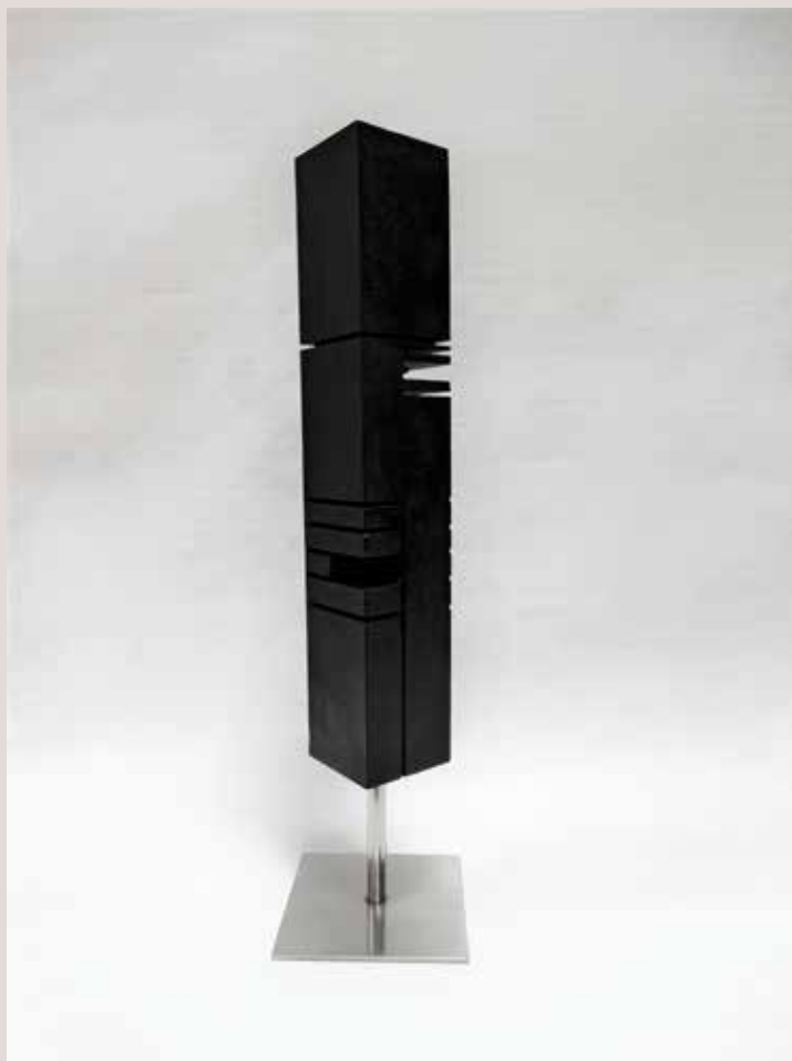
DESCONSTRUCCIÓ 2013-2017, granit negre i acer inoxidable, 57x14x14