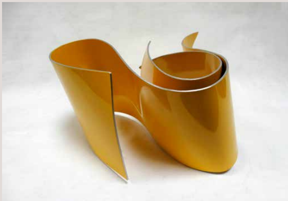
LÍNIES 2019, alumini pintat al foc, 22x32x40