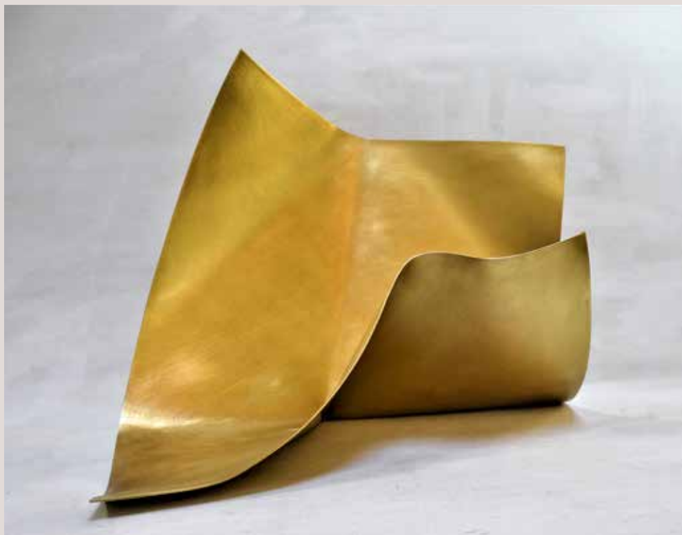
SACRA FLOR 2018-2019, llaut6, 36x40x21