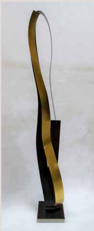
MÍSTIC 2016, ferro, llautó i pedra d'Ulldecona, 182,5x33x27