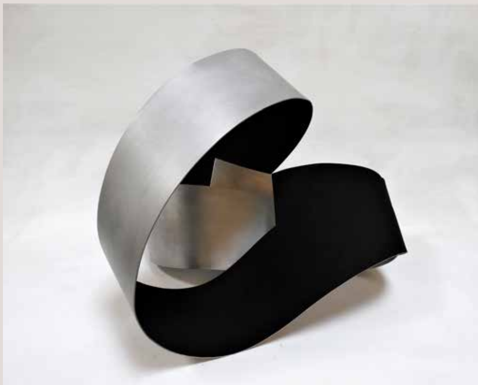
BI 2018, alumini i pigments, 41x48x51