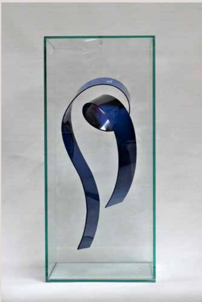
INTERIOR 2016, alumini pintat al foc i vidre, 50x22,5x22,5