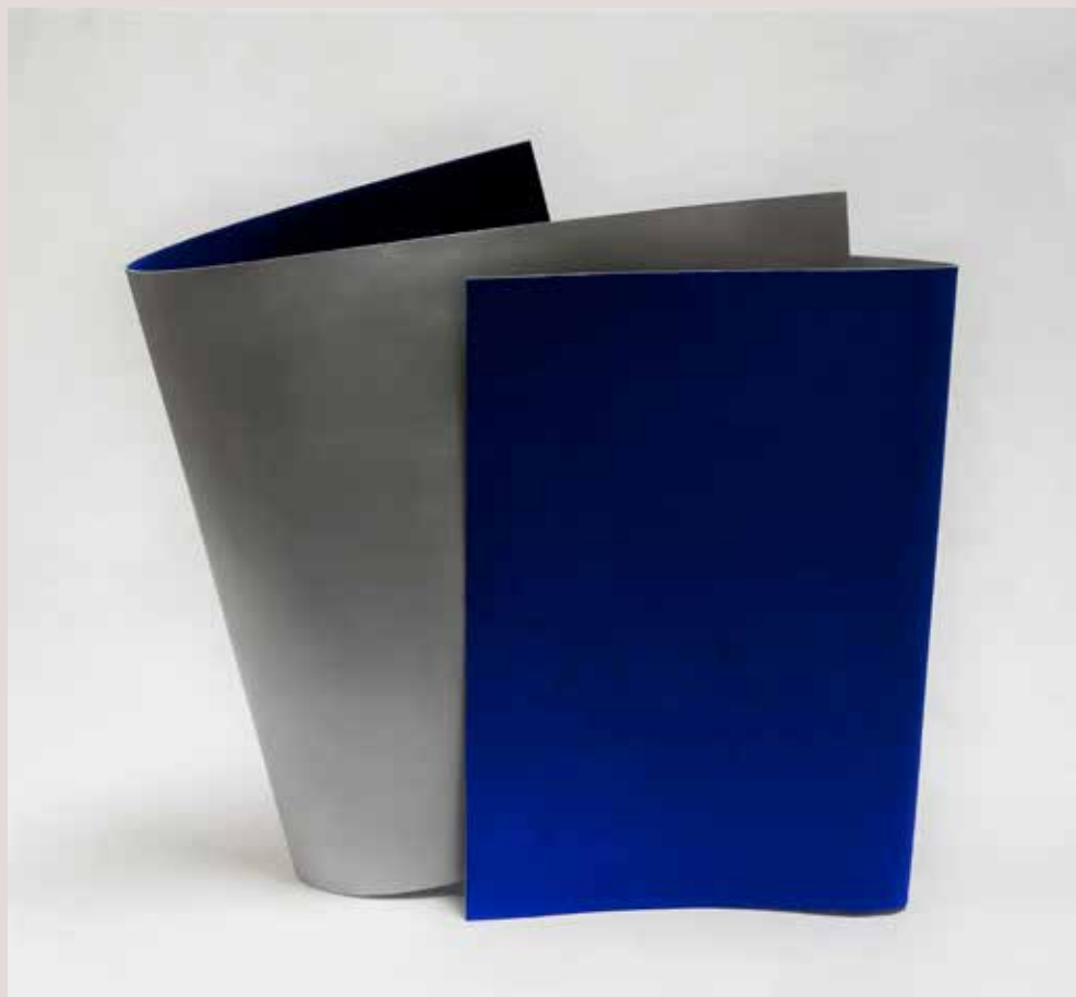
ACULL 2018, alumini i pigments, 52x53x10