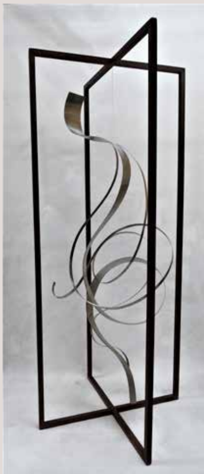
APARENCES II 2014, ferro i acer inoxidable, 180,5x80,5x80,5