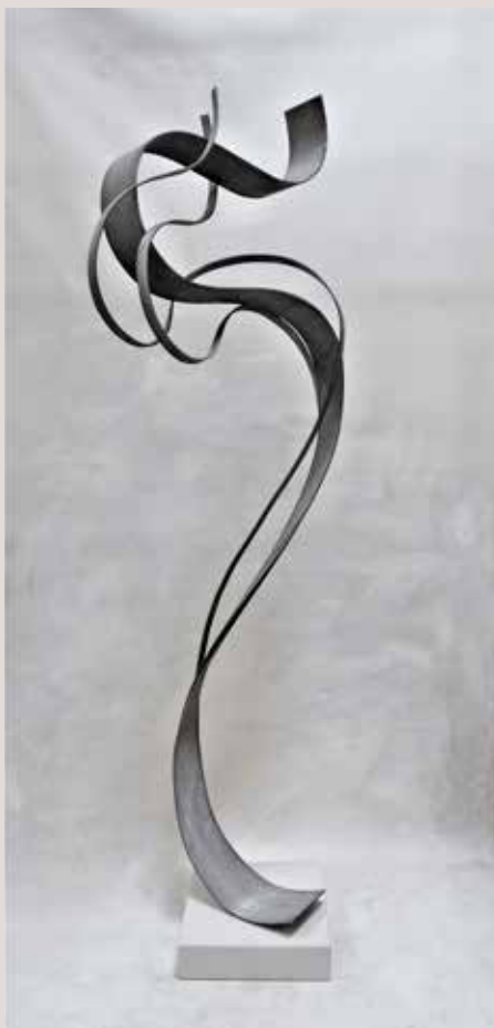
FILLLOL 2019, alumini i pedra silestone blanc, 187x47x55