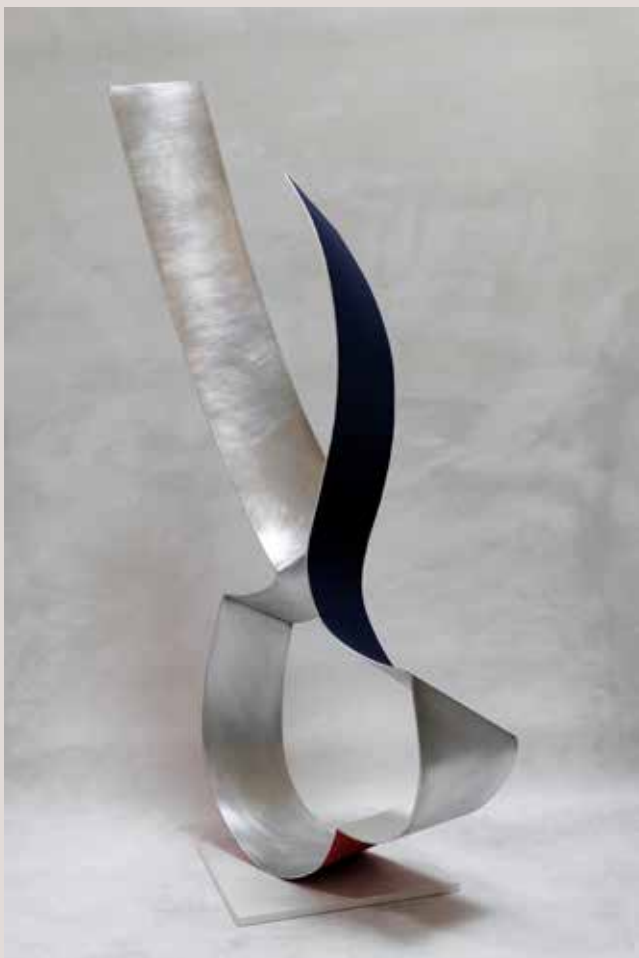
ROMP 2019, alumini, pigments i pedra sílestone blanc, 132x58x40