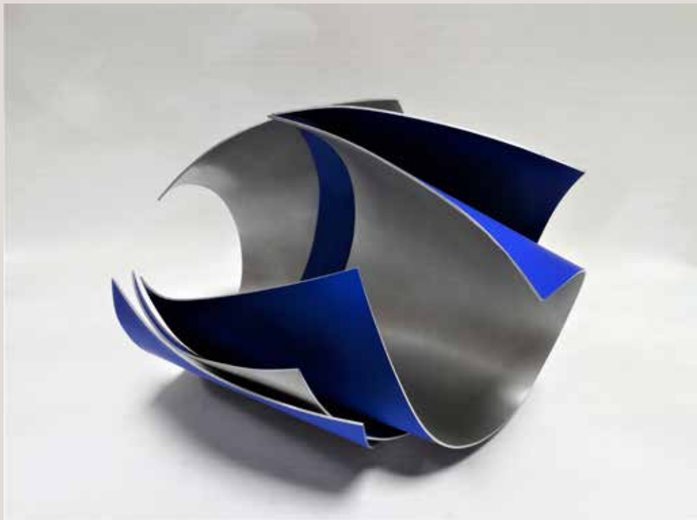
ACULL 2018, alumini i pigments, 26x36x27