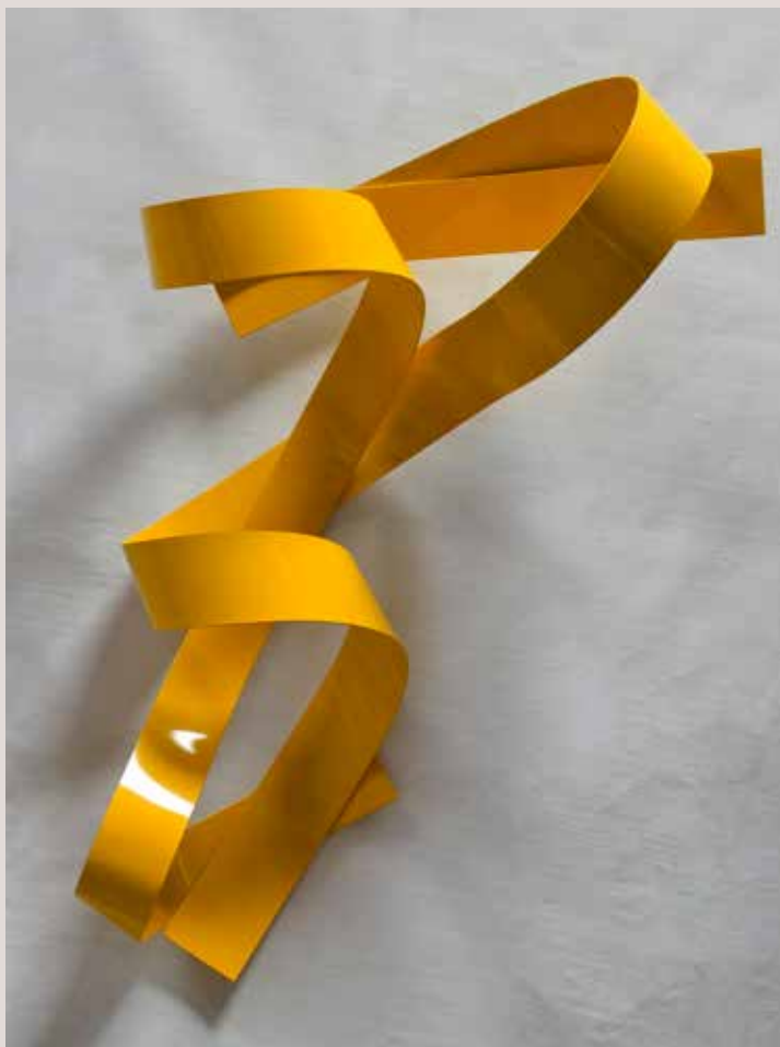
CORBANT 2019, alumini pintat al foc, 136x82x33