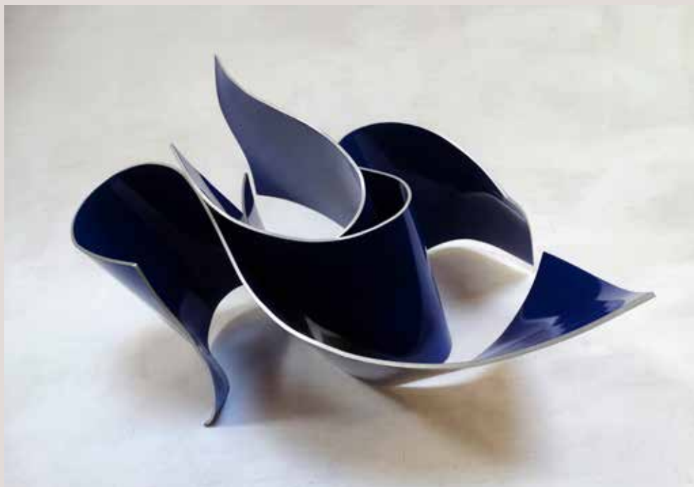
LÍNIES 2019, alumini pintat al foc, 30x45x40