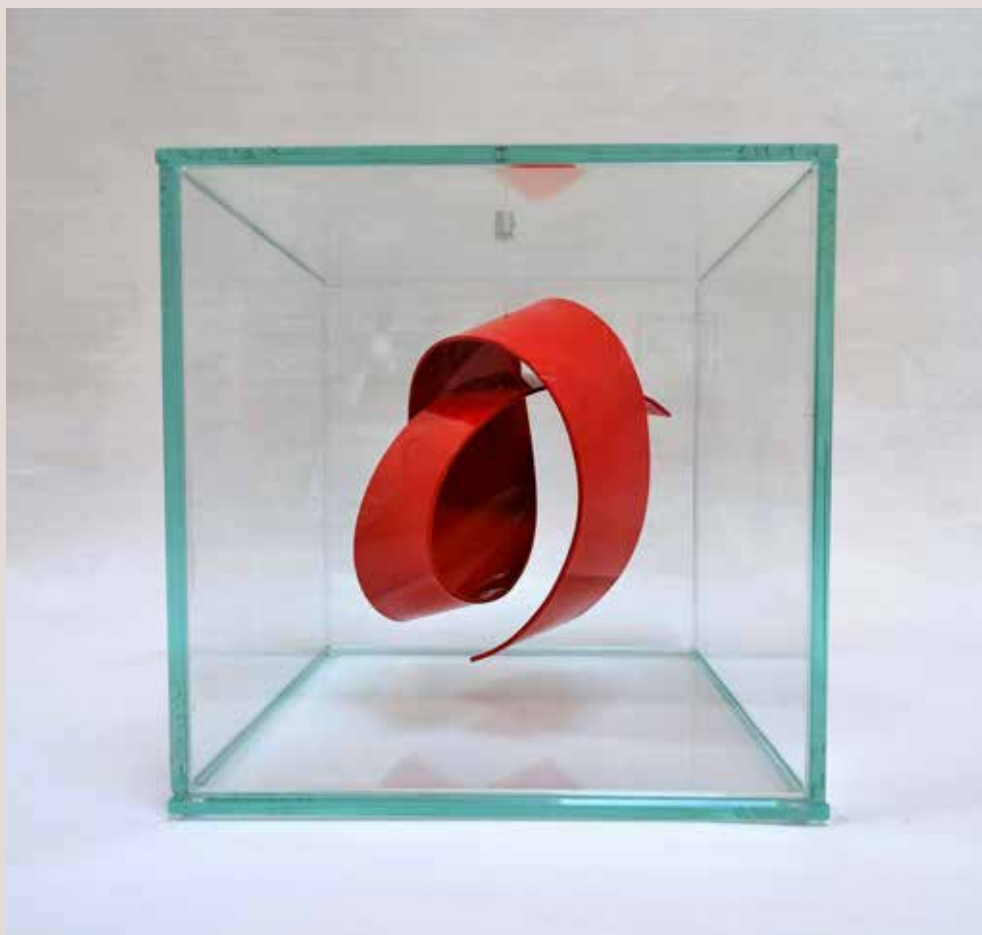
INTERIOR III 2016, alumini pintat al foc i vidre, 18x18x18