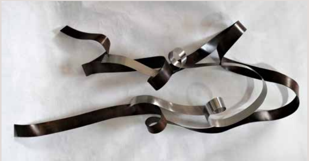
LAOCOONT 2017, ferro i acer inoxidable, 105x178x25