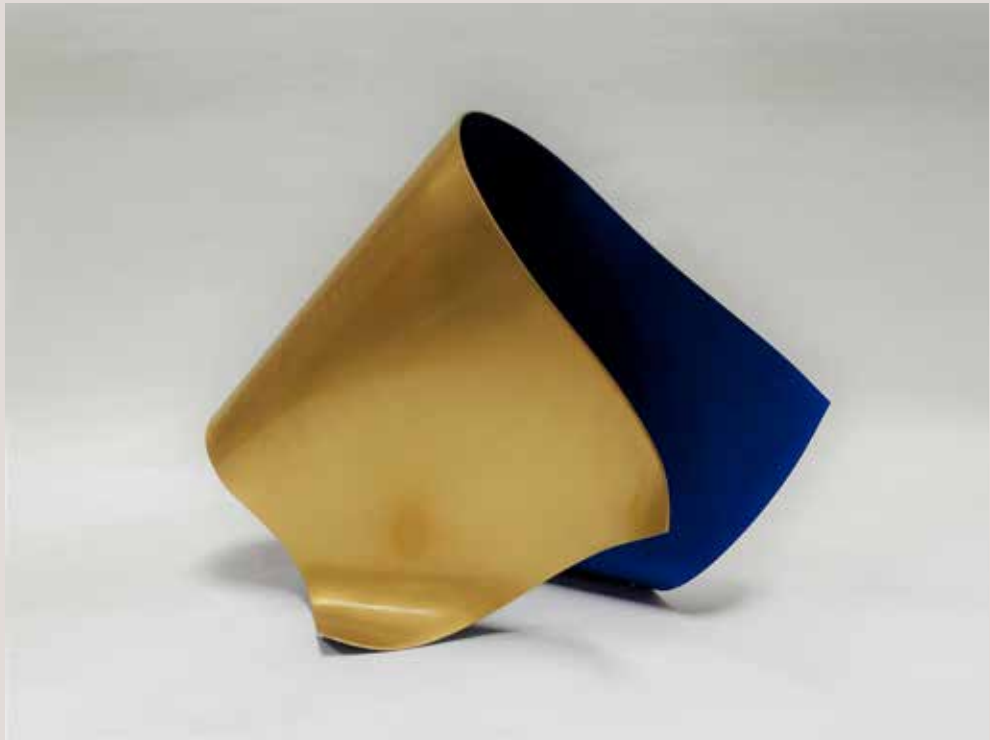
BLAU 2016, llaütó i pigments, 30x28x35