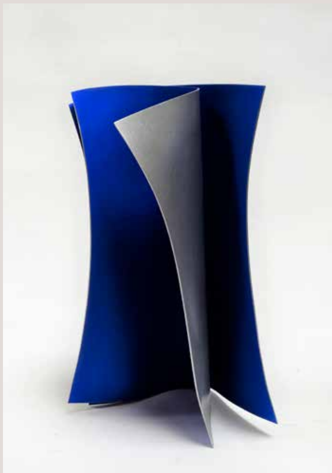
ACULL 2018, alumini i pigments, 32,5x13x14