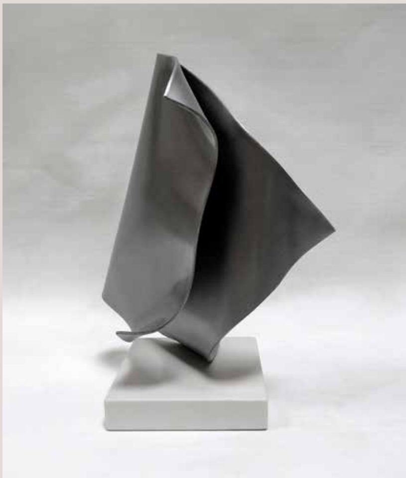
FULL 2016, alumini i pedra silestone blanc, 32x22x17