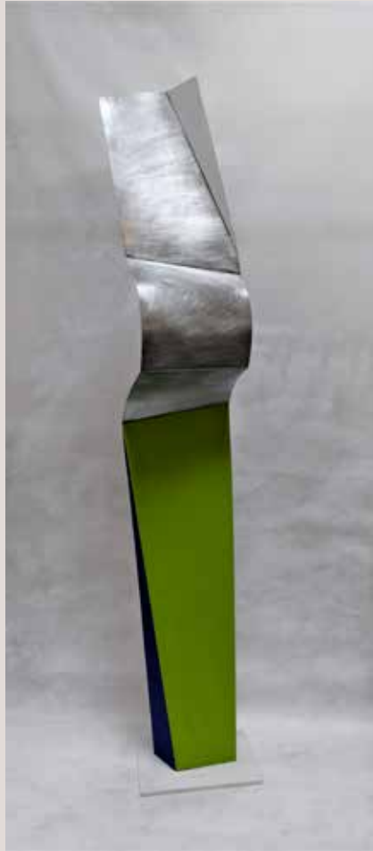
ROMP 2019, alumini, pigments i pedra silestone blanc, 190x43x32