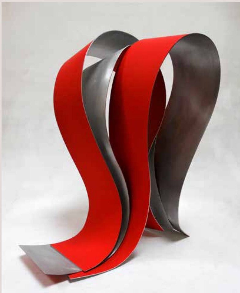
ACULL 2019, alumini i pigments, 60x44x55