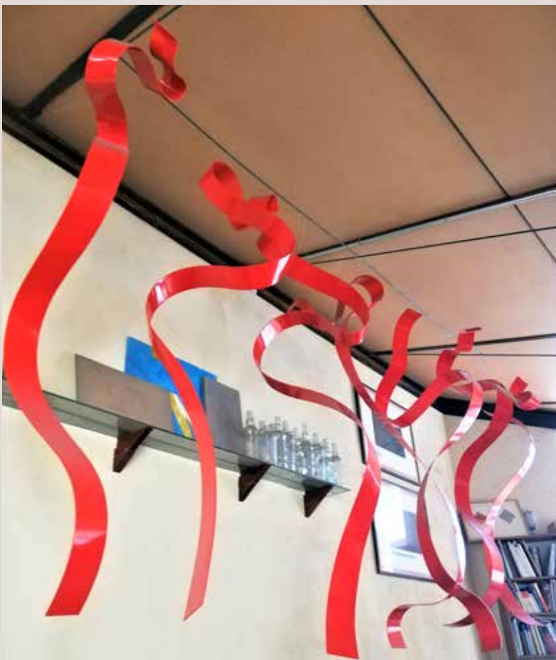
DAVALLAMENT 2015, alumini pintat al foc, 7 peces de mides variables