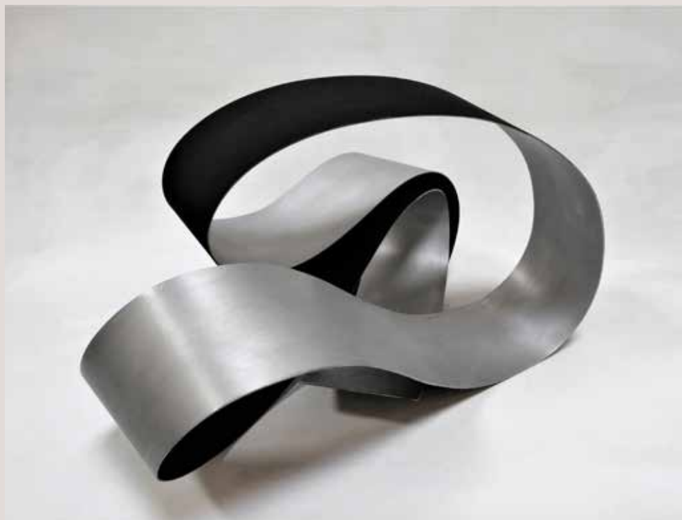
BI 2018, alumini i pigments, 34x52x35