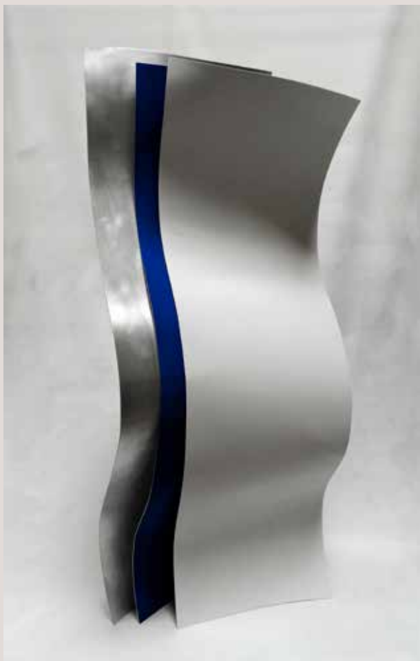
FULLS 2019, alumini i pigments, 118x49x29