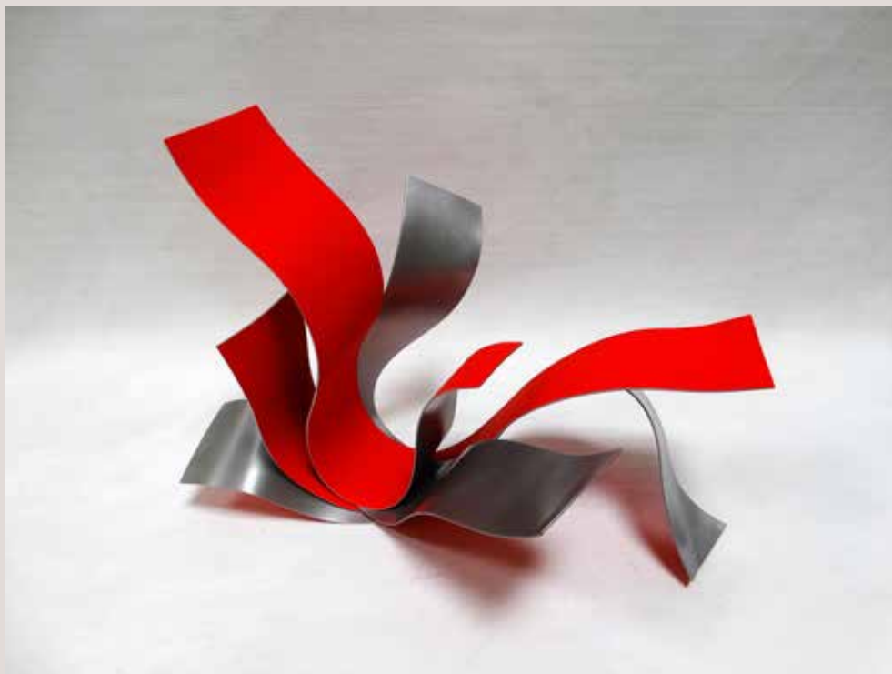
ACULL 2017, alumini i pigments, 31x41x28